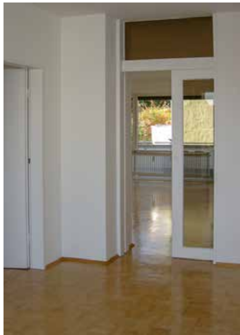
Blick von Essdiele ins Wohnzimmer