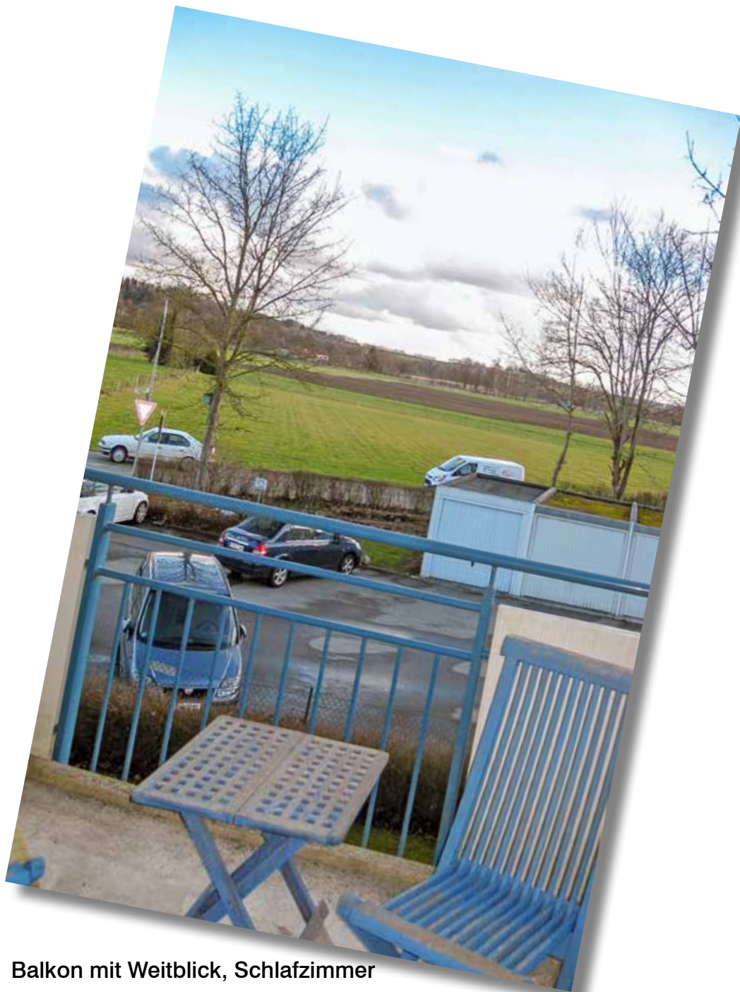
Balkon mit Weitblick, Schlafzimmer